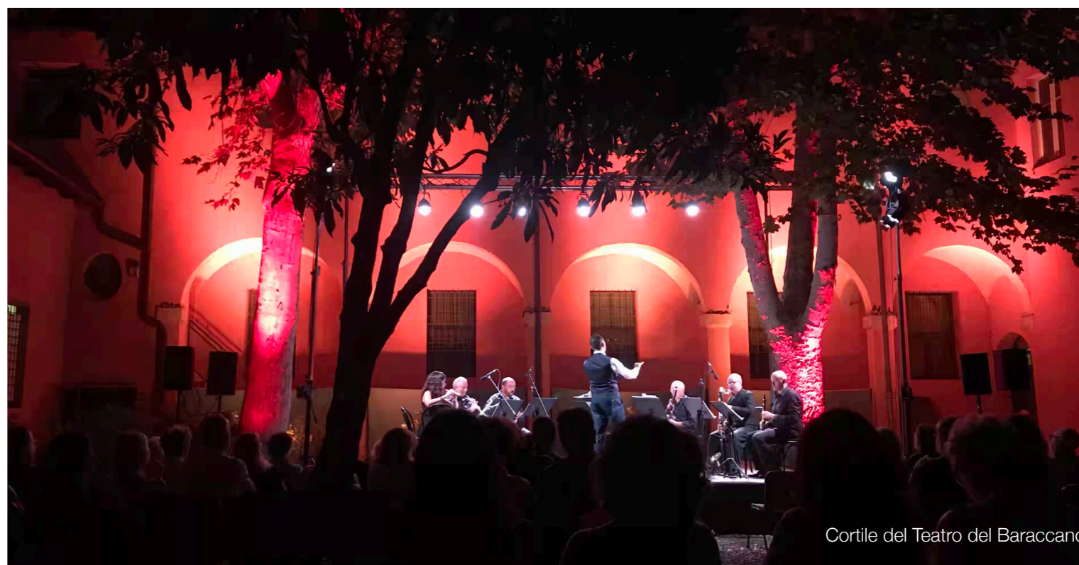
Cortile del Teatro del Baraccano

Nel nostro arrangiamento originale le otto parti reali che compongono l'ensemble cercano di riprodurre tutti i colori orchestrali pensati da Respighi, con l'intento di creare una sintesi affascinante tra il garantire la presenza di strumenti fondamentali per Respighi, come l'arpa e il clavicembalo, ed il ricercare un suono nuovo e moderno con l'inserimento di fisarmonica e basso tuba.