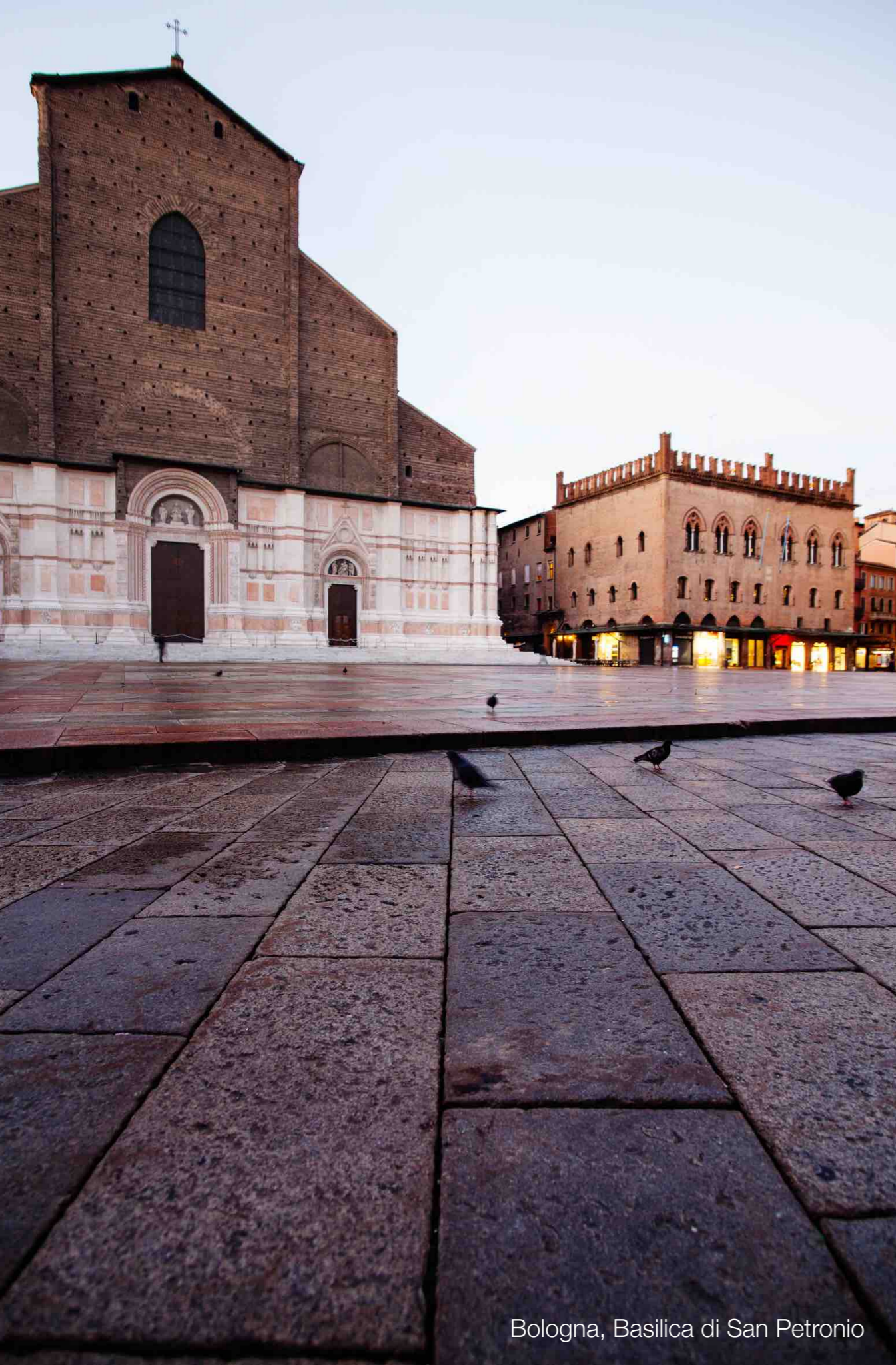
Bologna, Basilica di San Petronio